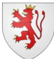
Het Hertogdom Limburg in 1477