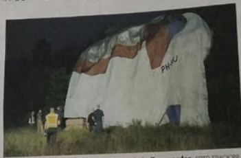
Van paniek was geen sprake, volgens de ballonvaarder.

Rakelings langs het kippenbos, landde hij net buiten de beboorde kom. In een weiland aan de Veestraat in Swalmen. De maand en lichtballon werden over de grond gesleurd, de vier inzittenden raakte lichtgewond. Ploetseling noodweer zorgde ervoor dat piloot Hans Pauw, zaterdagavond iets moest doen dat hij in duizend vluchten daarvoor nog niet had meegemaakt: een noodlanding maken vanwege noodweer.